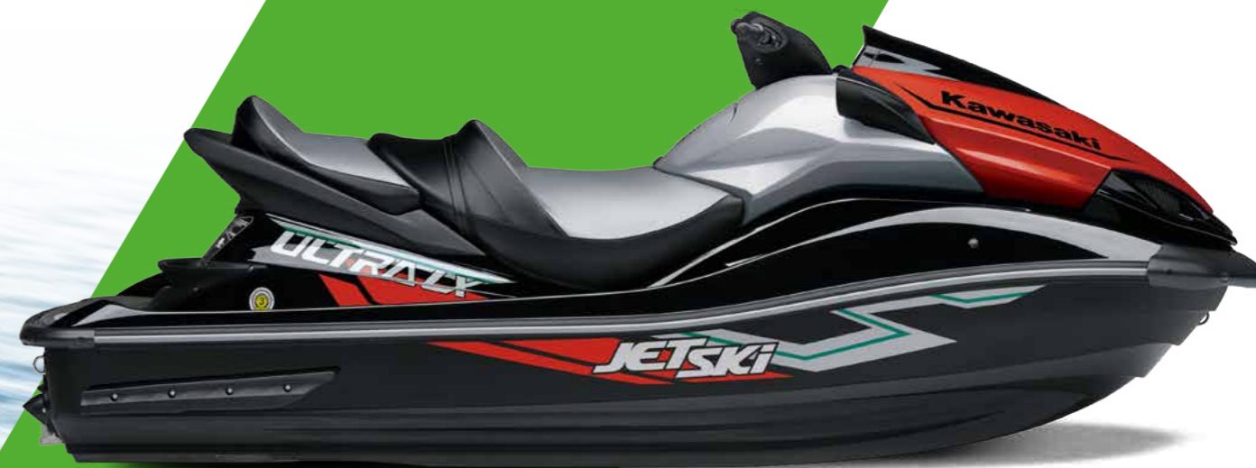
EBONY / SUNBEAM RED